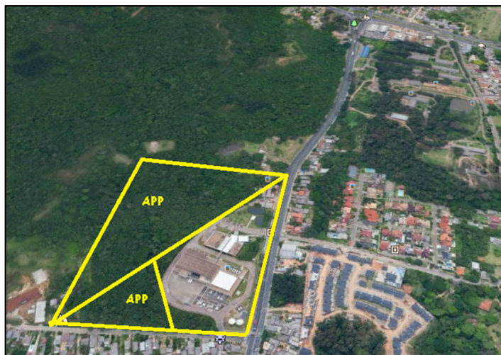
Figura 01 - Área de Localização CEITEC S.A.

Nos processos de fabricação de semicondutores na CEITEC S.A. os tópicos com maior relevância para seus negócios e partes interessadas, considerando os pilares da sustentabilidade, bem como a legislação ambiental aplicada às atividades e ainda o bem estar social, ambiental, e, econômico, são: